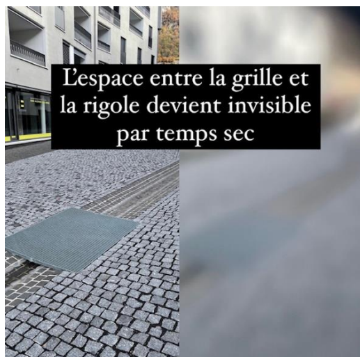
Quartier de la Monneresse 03.11.2021